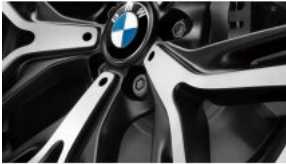
Болти-секретки для коліс S02PA