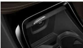
Підготовка автомобіля для курців S0441