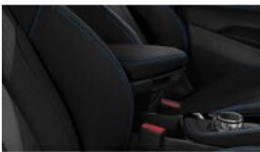
Передній центральний підлокітник S0473