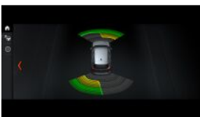
Система допомоги при парковці (PDC), передня і задня S0508