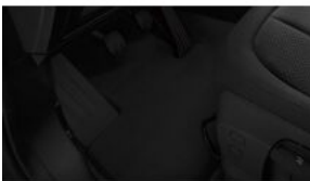
Велюрові килимки S0423