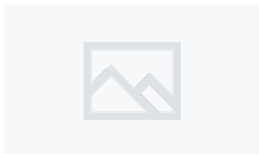
Меню російською мовою S06UD