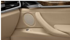
Акустична система HiFi S0676