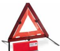
Знак аварійної зупинки і аптечка S0428