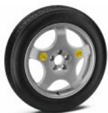
Запасне колесо-докатка S0300