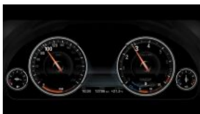
Багатофункціональний дисплей панелі приладів S06WB