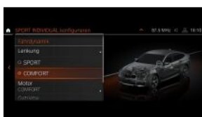
INTEGRAL ACTIVE STEERING S02VH