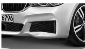
M AERODYNAMICS PACKAGE S0715