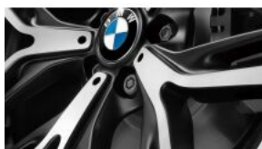
LOCKING WHEEL BOLTS S02PA