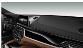
INSTRUMENT PANEL SENSATEC S04AW