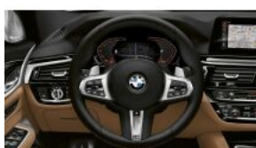
M LEATHER STEERING WHEEL S0710